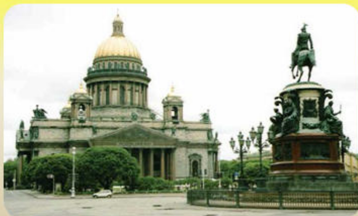
Исторический центр Санкт-Петербурга. А. А. Монферран. Исаакиевский собор. 1818—58 гг.