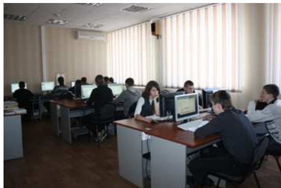
Лаборатория информационных технологий в профессиональной деятельности строителя автомобильный дорог и аэродромов