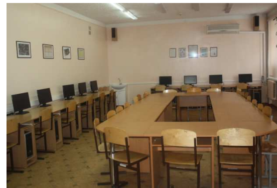
Лаборатория информационных технологий в профессиональной деятельности строителя