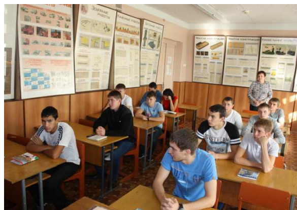
Учебный кабинет для теоретического обучения