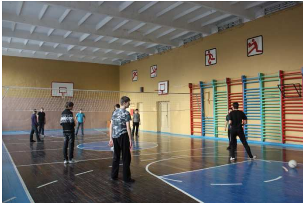
Спортивный зал большой