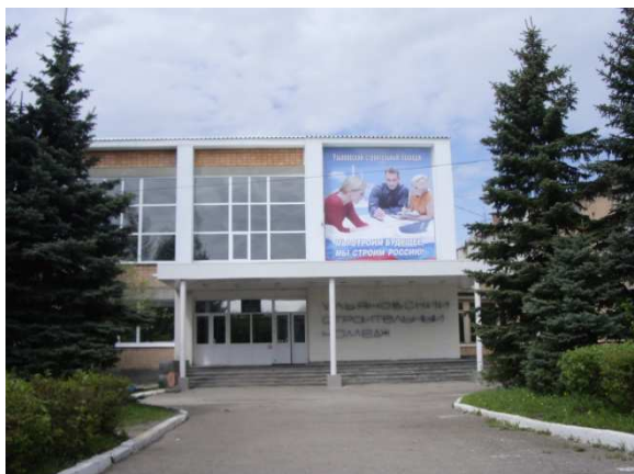
ОГБОУ СПО «Ульяновский строительный колледж»