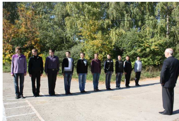
Плац для военно-строевой подготовки