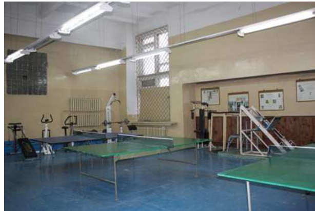
Малый спортивный зал