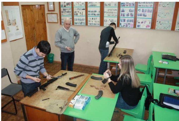
Уголок патриотического воспитания