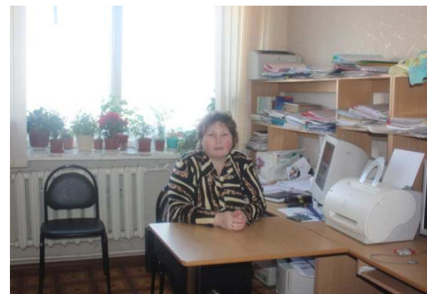
Кабинет социально-психологической службы