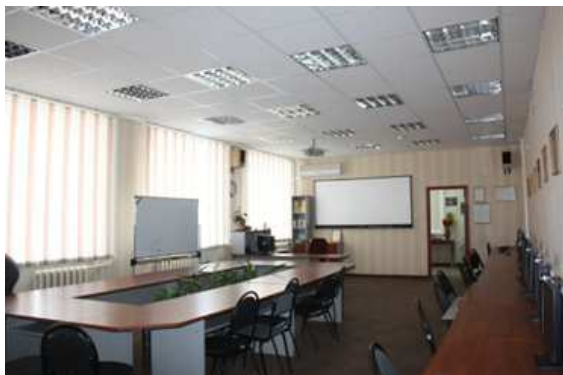
Лаборатория информационных технологий в профессиональной деятельности бухгалтера