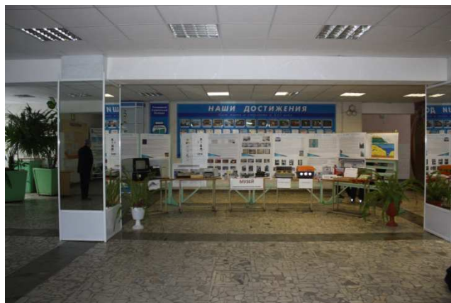
Фойе 1 этажа